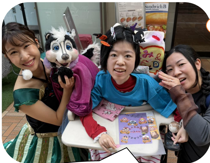
ひとみさん（クッキー） 仲良し友達と行った