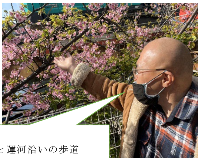
シーバンスと運河沿いの歩道