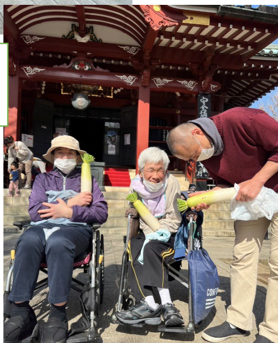
待乳山と奉納大根のおすそ分け