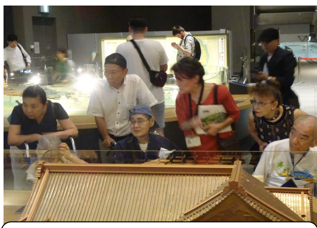
昔の江戸城?大名屋敷?について説明を受けてます。