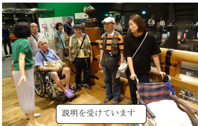
説明を受けています