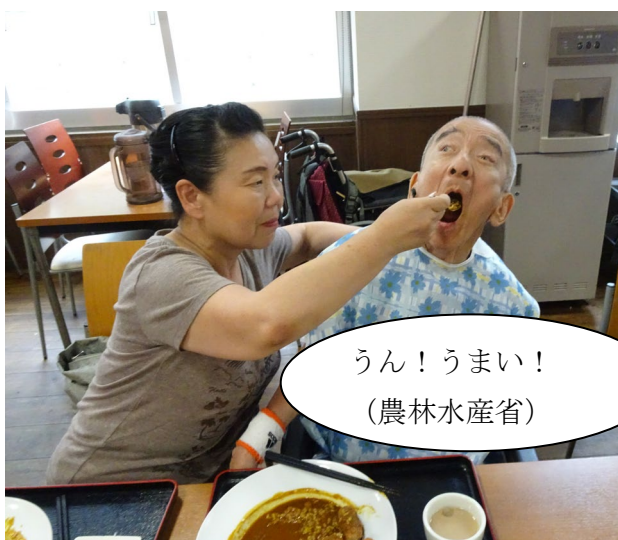
うん！うまい！ (農林水産省)