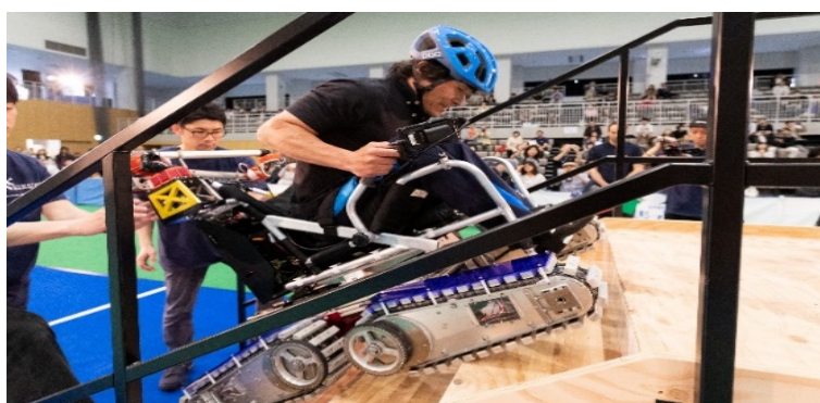
慶應大学理工学部のパイロットが階段を上る。

パラリンピックがあと1年後になりましたが、これとは別の、サイバスロンという障害のある人の国際競技大会があります。これは、技術者と障害のある人たちが最新の科学技術を駆使した機器を使って競います。サイバスロンは、スイ