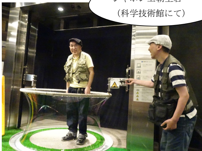
シャボン玉朝生君 (科学技術館にて)